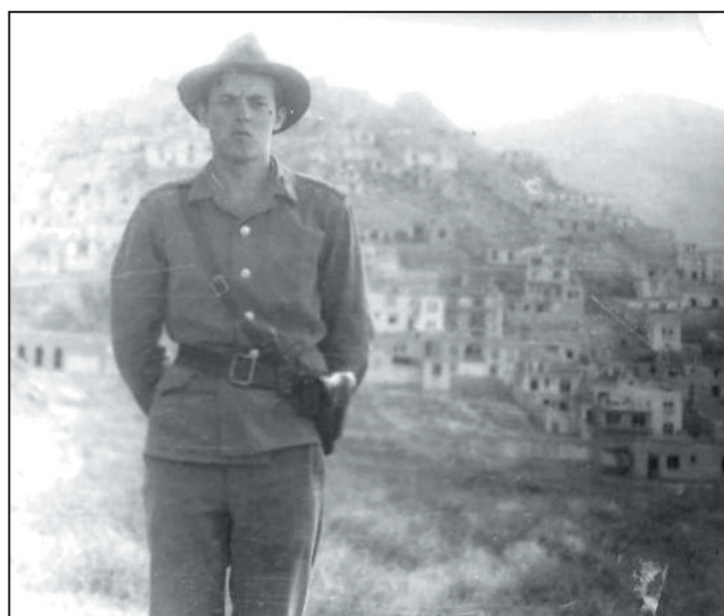
Вид на Кабул, первые дни нахождения советских войск в Афганистане

Мировоззрение мое после того, как я оказался в Афганистане в целом не поменялось, хотя там наиболее ярко проявились все скрытые изъяны советского общества, выразившееся, скажем, в жажде наживы отдельных руководителей, имевших возможности приторговать, имела место и «торговля» орденами и медалями лицам, не